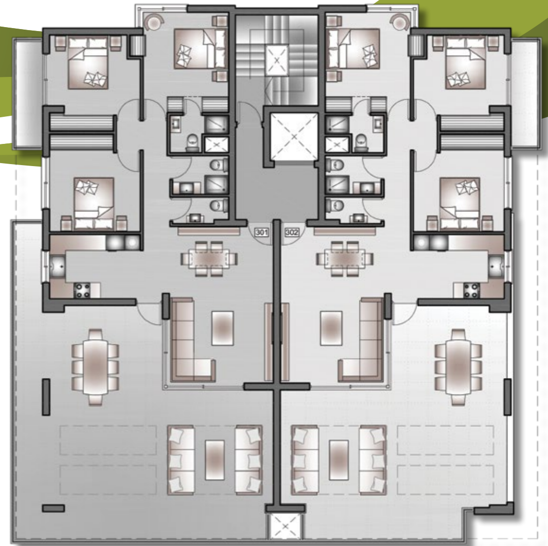
3 rd Floor